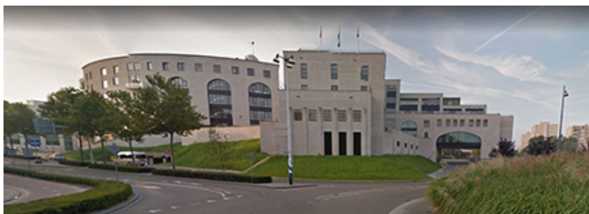
Maankwartier te Heerlen

De uitspraak van 3 augustus 2016 heeft betrekking op een koopovereenkomst, waarbij de gemeente Heerlen een nog te vestigen appartementsrecht op het uitsluitend gebruik van kantoorruimte aan de Spooringsel/Looierstraat als onderdeel van het Maankwartier-herontwikkelingsproject, koopt voor meer dan € 10 miljoen. 99 Metroprop, een stichting die actief is in de onroerendgoedmarkt, vordert een verklaring voor recht dat de gemeente als koper en Maankwartier Heerlen B.V. als verkoper, in strijd met het staatssteunrecht en daarom onrechtmatig hebben gehandeld. Hiertoe voert Metroprop aan dat de koopprijs niet-marktconform zou zijn. In dit verband verwijst Metroprop naar een door haar als deskundigenbericht gekwalificeerd rapport dat een 'indicatieve' marktwaarde van het koopobject heeft bepaald op € 670,000.